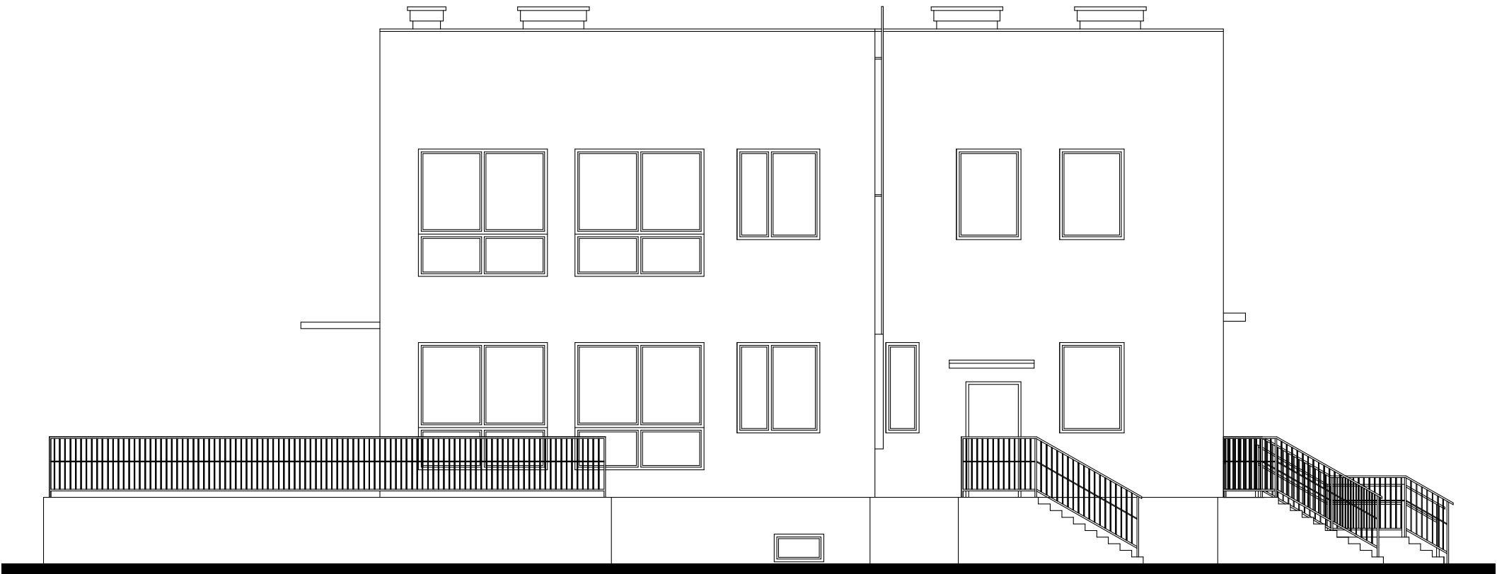
Elewacja północna 1:100